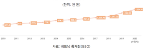
베트남의 도축 및 판매된 가금육 생산량 추이(2010~2020)

소득의증가는 베트남 소비자의 식품 선택에 대한 취향 변화를 이끄는 요인으로 베트남 소비자들의 경제 성장을 통해 전분 소비를 줄이고 육류 소비를 늘리는 경향을 보였다. 베트남 통계청에 따르면 2020년 베트남의 육류 생산량은 약 537만 톤으로 2019년 대비 3.5% 증가했으며, 가금육 생산은 150만 톤으로 2019년 대비 16% 증가했다.